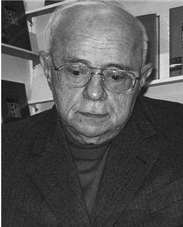
Stanisław Lem, 1921-2006